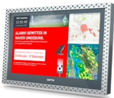
Informations-Display im Schwimmmeister-Büro