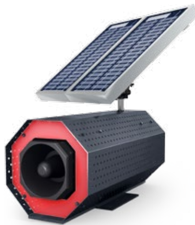
Sirenenalarm im Aussenbereich